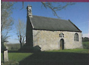
Chapelle St Michel